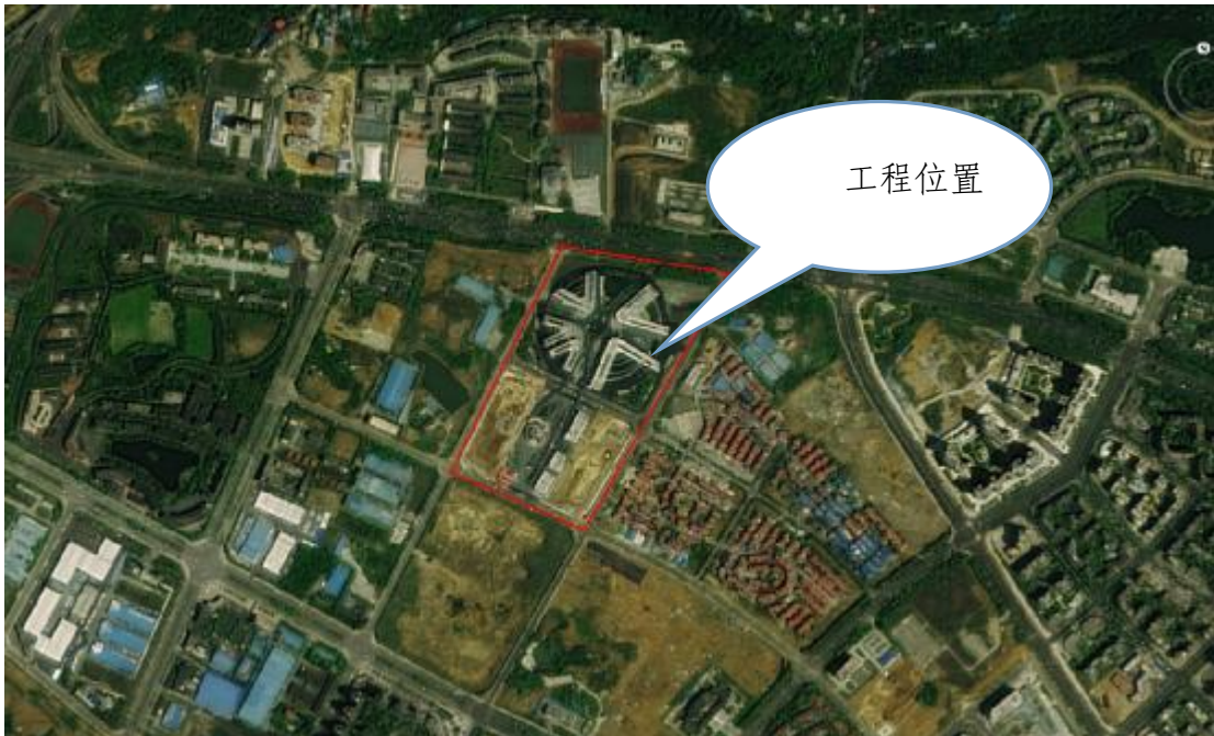
图 1.1-1 工程区地理位置

科技城创新中心位于绵阳市九州大道中段，地理坐标为 N31^{\circ} 29' 32'' ， E104^{\circ} 41' 34'' 。项目分为四期建设，一期项目位于二三四期东面约 300m，与二三四期项目不在同一地块内。二三四期项目作为整体统一规划和设计，整个地块项目分三期建设。工程区位于绵阳市城区范围内，四面均有已建市政道路，交通便利。