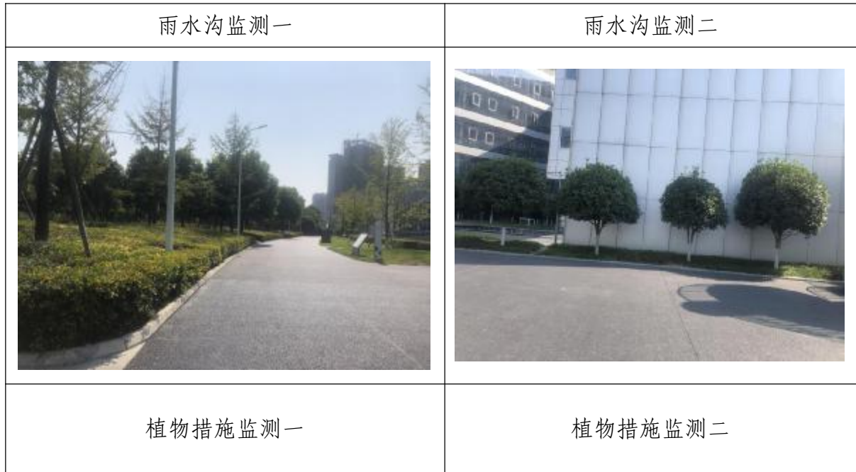
图 3 现场调查图片