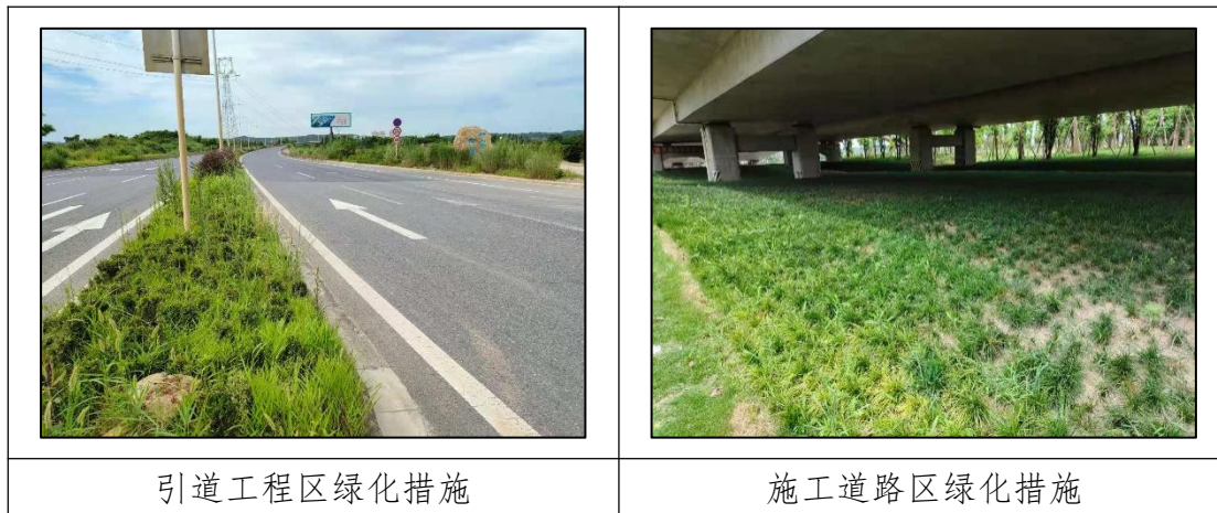
表 5-1 水土保持措施初期运行情况