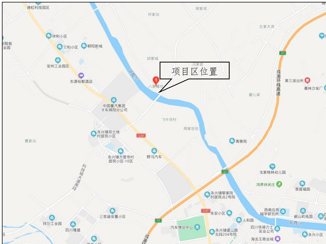
图 1-1 项目地理位置示意图

项目地理位置：八家堰安昌河大桥工程位于绵阳市西北部的科技城新区内，是连接安昌河两岸科技城区块的纽带，南起高新区5号路（K20+960），北至安昌河左岸175m（K22+080），全长1.12km。项目地理位置见图1-1。